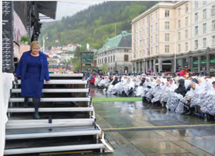
Statsminister Erna Solberg er oppvokst med regn i Bergen, men hadde verken paraply eller støvler da hun talte under Festspillene i Bergen i mai.