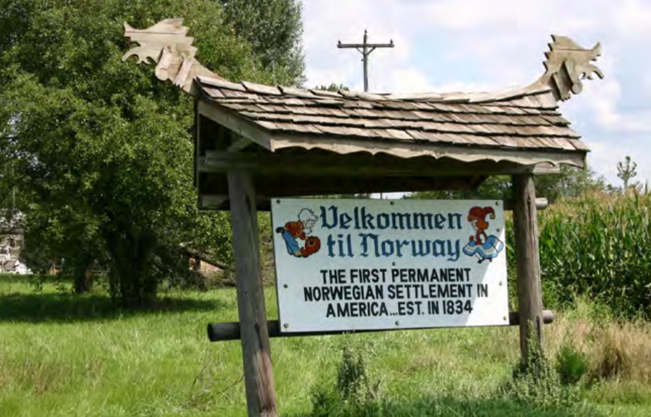
Norway i Illinois er den første permanente norske bosetningen i Midtvesten og ble grunnlagt av norske innvandrere i 1834.

at mange av de amerikanorske ordene knapt er i bruk lenger i tilsvarende dialekter i Norge.