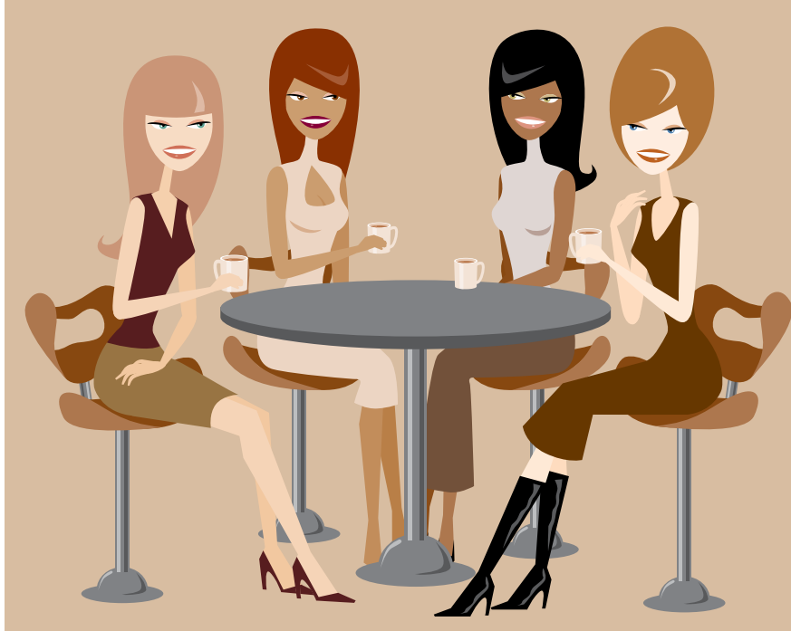
Er du mer eller mindre kaffekjerring?

nelser, som plinge , gutter , bajas og ny-norskfolk , og også andre betegnelser, som prosjekt , tiltak og østkant . Det er ikke vanskelig å være uenig i at det er mer prosjekt å sy om kjolen enn å kjøpe en ny, eller at Furuset er mer østkant enn Torshov.