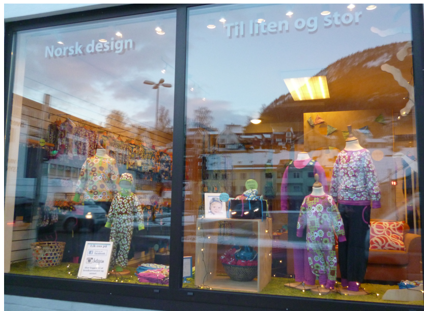
Figur 20: “Norsk design”, “Til liten og stor”.

På tross av manglende skilt og navn på butikken, er den språklige profilen godt synlig på fasaden: