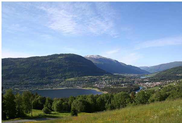
Figur 2: Voss

“Kvar so ferdamannen vender augo, fær han lesa det [bokmålet]. Han møter det på oppslagi i jarnvegsvognene og på stasjonane, - me skal vel ikkje rekna på dei fatige oppslagi på nynorsk som me hev fenge på Dovrebana og Bergensbana –, på billetten han gjev konduktøren, i ruteboki han ser i, avisone han les; han møter det på gateskilti og forretningsskilti i gatone, og på hotellet han tek inn i. Den tokken han fær av alt dette skrivne, kann lett vildra noko meiningi hans um talemålet òg.” (Indrebø 1932 , 67-f.)