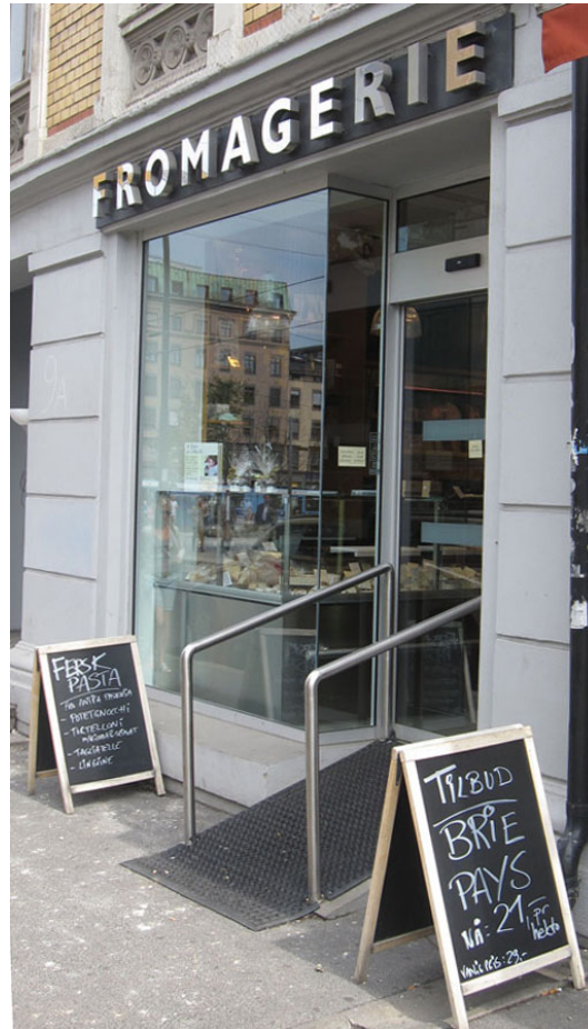
Figur 9: Fromagerie

Den første ostebutikken som skal diskuteres her, heter Fromagerie og ligger på Majorstuen: