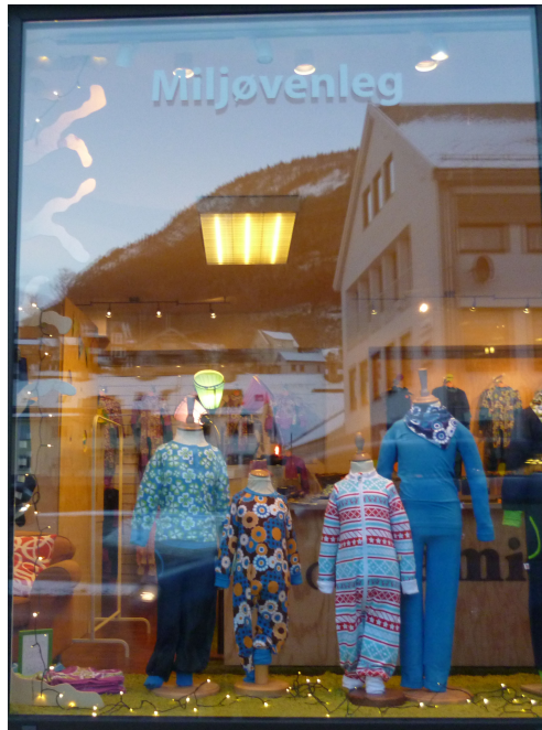
Figur 21: “Miljøvenleg”.