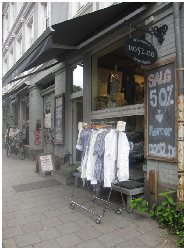
Figur 6: no52.no

Denne butikken har en annen språklig strategi enn Benetton. no52.no ligger i Thorvald Meyers gate 52 på Grünerløkka, og navnet på butikken knytter butikken ikke bare til lokalmiljøet, men til denne ekstatte adressen. Navnet viser dessuten at butikken har en nettbutikk, så selv om butikken er ekstremt lokal, henvender den seg også ut i verden. Navnet uttrykker altså noe veldig lokalt (adressen), men også noe globalt tilgjengelig (nettbutikken). Sånn blir navnet en hybrid mellom noe lokalt og noe globalt. Navnet kan også tolkes som en hybrid mellom norsk og engelsk. Forkortelsen no kan oppfattes som engelsk, men den kan også oppfattes som gammel gjennom å konnotere dansk skriftspråk.