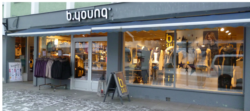
Figur 15: b.young

Navnestrategien til b.young er gjenkjennelig fra diskusjonen om Benetton i Oslo. Selv om navnet b.young har en klar semantikk og et budskap til kunden, er det tydelig at bruken av engelsk likner på hvordan Benetton brukte engelsk. Hovedpoenget i argumentasjonen om språkvalgene til disse butikkene er at for kjedebutikkene er det dobbelt positivt å markedsføre seg på engelsk. Den ene grunnen er at det kan oppfattes som progressivt og moderne gjennom den symbolverdien engelsk har på en global markeds plass, og den andre grunnen er at det er en økonomisk besparende måte å bruke ressurser på. Ved å markedsføre seg på engelsk i alle landene kjedene opererer, trenger de ikke ta stilling til lokale språkforhold, de trenger altså ikke lokal ekspertise. Samtidig trenger de bare å lage ett eksemplar av alt reklamemateriell, og dette materialet kan masseproduseres i lavkostland og brukes overalt. Legg særlig merke til at salgsplakatene hos b.young er på engelsk sånn som de var hos Benetton.