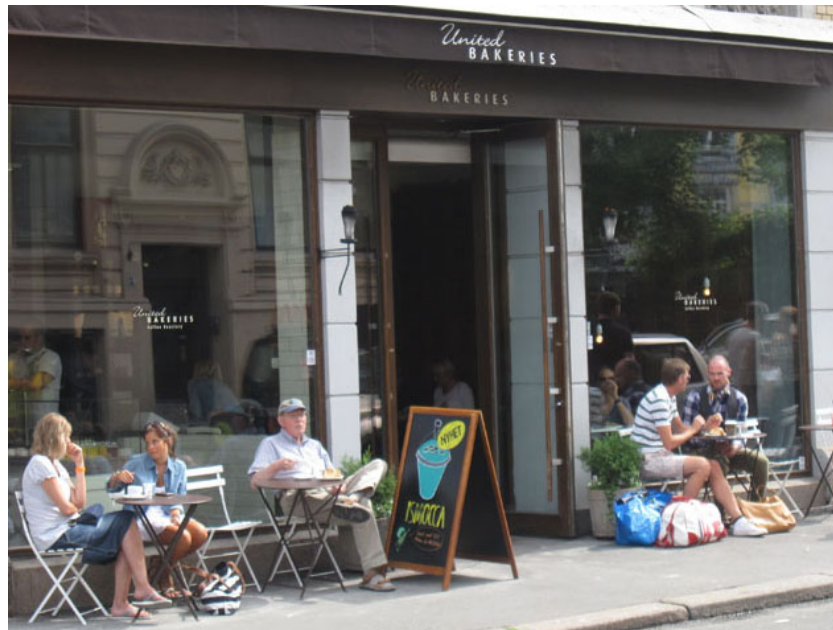
Figur 8: United Bakeries

Dette er en annen navnestrategi enn den som blir brukt hos bakeriet United Bakeries . United Bakeries er en norsk bakerikjede som har valgt et engelsk navn.