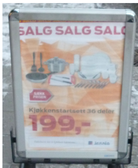
Figur 17: "Kjøkkenstartsett 36 deler"

Teksten på plakaten er uklar, men kommer tydeligere fram på dette bildet: