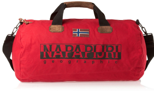
Figur 24: Bag fra Napapijri med logo og norsk flagg.

smalere geografisk nedslagsfelt, kan – slik det er framstilt her – ha et eget markedspotensiale ved å representere det spesielle, uvanlige, og kanskje også konnotere verdier som miljøvennlig, tradisjonelt og nært. Dette er ikke egentlig noe nytt i markedsføringssammenheng. For eksempel har flere klesmerker hatt suksess med å konnotere en slags norsk historisitet, som for eksempel det tyske klesmerket Thor Steinar , der produsenten hevder den runeinspirerte logoen er en hyllest til det historiske Norge. 30 Dessuten har det italienske merket Napapijri markedsført seg med et norsk flagg i logoen: