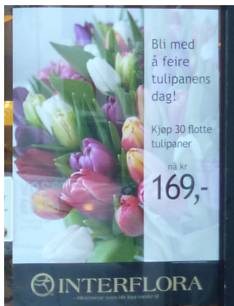
Figur 18: Bokmål på plakat: “Kjøp 30 flotte tulipaner”.

Denne tendensen med bokmål på plakater er også godt synlig på de trykte plakaterne i blomsterbutikkene. Selv om blomsterbutikkene ofte er enkeltstående butikker, og ikke del av en kjede, samarbeider mange av dem gjennom blomsterorganisasjonen Interflora , som består av 375 blomsterhandlere i Norge. 28 Derfor har flere ulike blomsterbutikker de samme plakaterne i vinduene, som denne som er vist her: