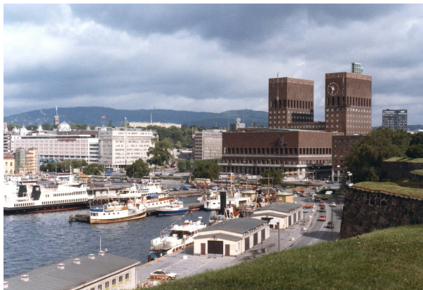
Figur 1: Oslo