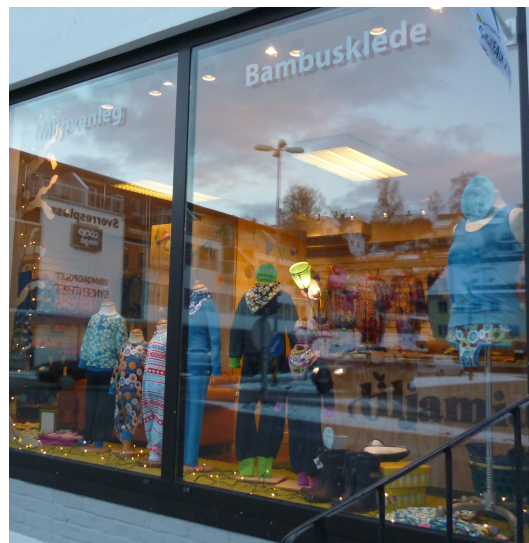
Figur 22: “Bambusklede”.

Bildene viser at hun bruker nynorsk i butikkvinduene, der det står “Norsk design”, “Til liten og stor” “Miljøvenleg” og “Bambusklede”, og innehaveren fortalte at hun var opptatt av at butikken skulle være “vossisk”.