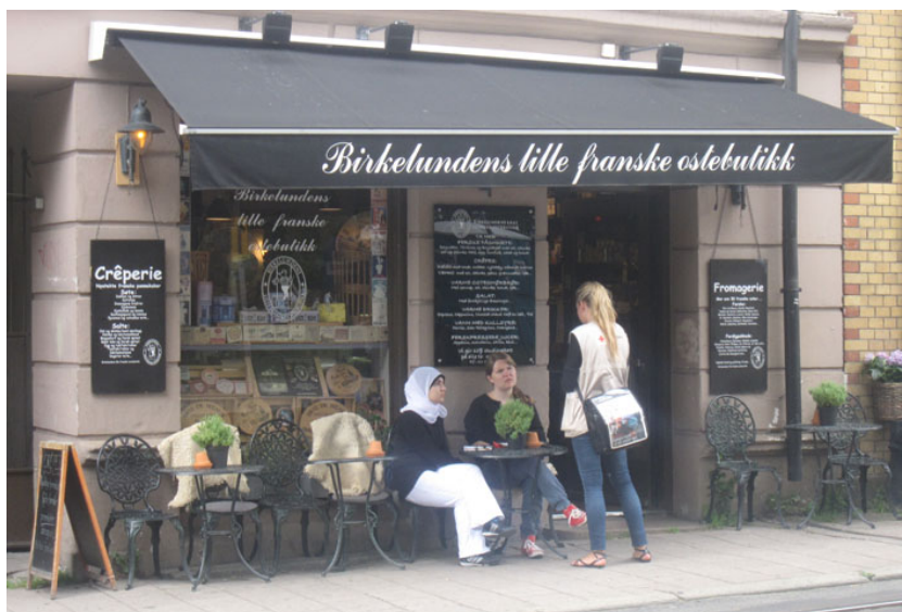
Figur 10: Birkelundens lille franske ostebutikk

I analysen av lingvistiske landskap i Stjernholm (2013) står todelinga mellom Oslos øst- og vestkant sentralt. Kategoriseringa av butikknavn etter språk på Grünerløkka og Majorstuen, som ble presentert i figur 4 på side 8, viste at på Grünerløkka, som ligger i øst, var norsk språk i butikknavnene mye hyppigere enn på Majorstuen i vest. Generelt er også kontrasten mellom den globale moderniteten og den mer tradisjonelle moderniteten, som ble diskutert i forbindelse med Benetton og no52.no, noe som kan sies å skille de to byrommene fra hverandre. Mens det lingvistiske landskapet på Majorstuen er prega av det som kan kalles en mer global modernitet, med mye bruk av engelsk i butikknavnene, og der semantikken i butikknavnene kan se abstrakt ut i en norsk kontekst, som for Benetton, er byrommet på Grünerløkka prega av norsk språk og navn som er mer semantisk gjennomsiktlige, som no52.no. På bakgrunn av dette kan man si at byrommet på Grünerløkka i større grad er prega av en tradisjonell modernisme, der det moderne er mer knytta til det som kan kalles mer nære eller lokale verdier. Ostebutikken Fromagerie ligger på Majorstuen og føyer seg sånn sett inn i dette bildet ved å ha et fransk navn. I tillegg til å ha et navn som ikke er norsk, er ikke betydninga av navnet nødvendigvis tilgjengelig for alle nordmenn. For ostebutikken på Grünerløkka er dette annerledes. Der heter ostebutikken Birkelundens lille franske ostebutikk :