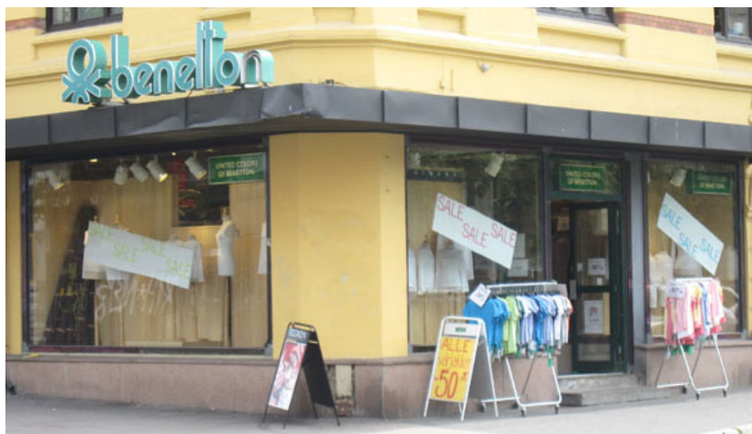
Figur 5: Benetton