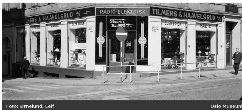
Figur 13: Thilmers og Haavelsrud Radio-Elektrisk Oslo, 1956.

I dette underkapittelet vil det bli presentert en kvalitativ analyse av navngiving og språkvalg på Voss. Analysen vil vise at språkvalg henger sammen med det som kan kalles nedslagsfelt for butikkene. Det innebærer at geografisk beliggenhet og rekkevidde har betydning for språkvalgene i butikkene. Dette vil jeg komme tilbake til rett under, men først vil jeg diskutere kort en navnegivingstendens som er svært hyppig på Voss. Mange av butikkene der har et navn som består av enten et personnavn eller et stedsnavn pluss et tillegg som utdyper hva butikken driver med, som Veronicas Hårdesign eller Voss Avløysarlag og Maskinring . Det at dette er så hyppig brukt, bidrar til å gi handelssentrumet i Voss et tradisjonelt preg. Det vil ikke bli gjort noen større historisk analyse av lingvistiske landskap her, men det følgende bildet er fra Oslo i 1956: