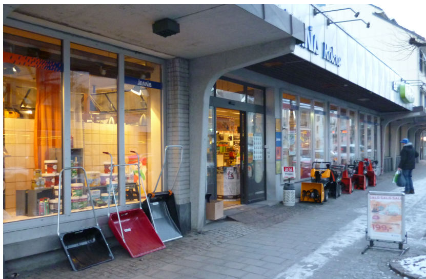
Figur 16: Jernia med salgsplakat på bokmål.

Teksten på plakaten er uklar, men kommer tydeligere fram på dette bildet: