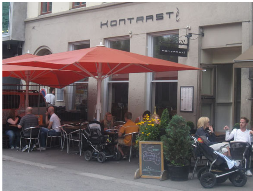
Figur 7: Kontrastè

Restauranten Kontrastè representerer en annen måte å ivareta både norske og utenlandske referanser på én og samme tid. Restauranten har et navn med klare franske referanser. Men kontrast på fransk skrives med 'c', og hvis dette skal være et fransk verb, går aksenten feil vei. Eieren kommuniserer franskhet, men dette er ikke fransk. Det er heller ikke norsk, men