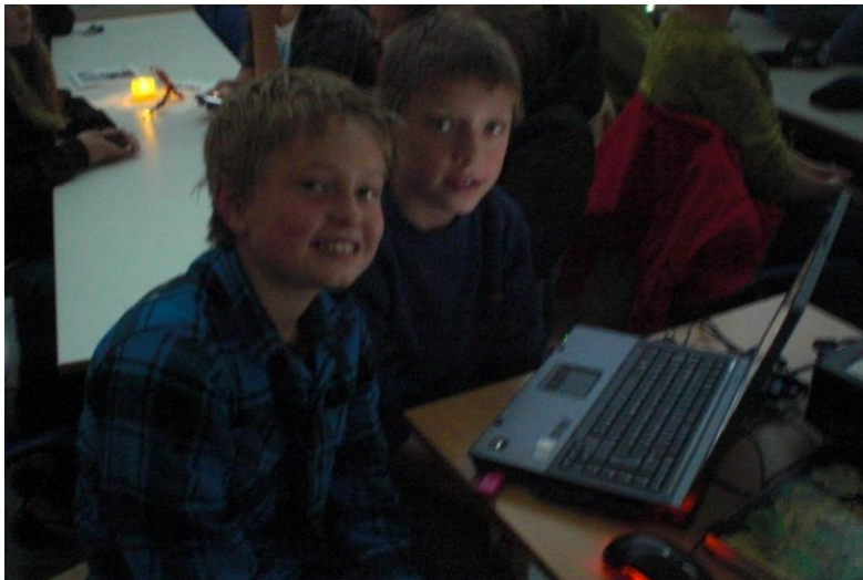
Her er vi i full gong med kallenamnsprosjektet vårt

I tillegg bestemte vi oss for å leite etter bøker på folkebiblioteket vårt om kallenamn, og vi ville undersøkje litt på Internett om fenomenet kallenamn.