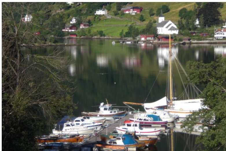
Glimt frå Bruvik ein solskinsdag dag i september.

Litteratur om kallenamn: http://folk.uib.no/hnoiu/navn/divnavn/kallenavnritt.htm